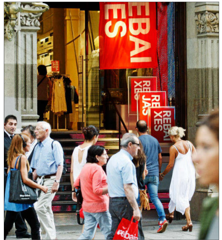
Establecimiento en plena campaña de rebajas.