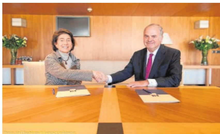
Paloma O'Shea e Ignacio Polanco durante la firma del convenio de colaboración entre el Grupo Timón y la Fundación Albéniz