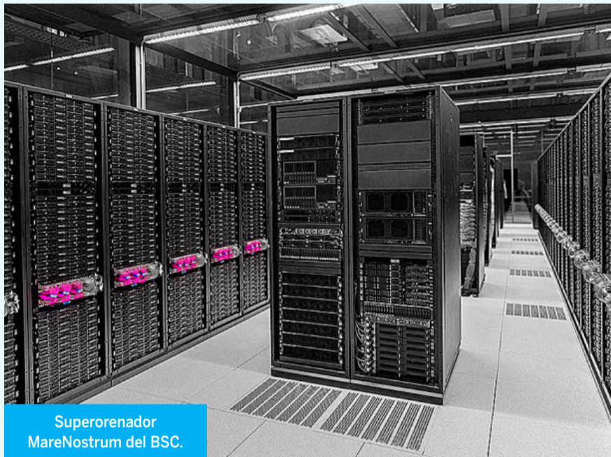
Superordenador MareNostrum del BSC.

“Madrid es el piloto y ha validado sus términos y condiciones. En la versión nacional estamos trabajando con la AEPD para encontrar el equilibrio justo entre protección de datos de la ciudadanía y la información necesaria en una situación como esta”, dicen en la Secretaría de Estado de Digitalización. Todavía no hay un plazo oficial para el lanzamiento en el resto del territorio.