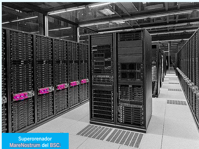
Superordenador MareNostrum del BSC.