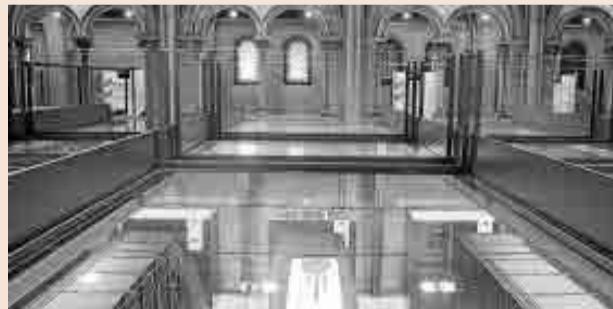
Barcelona Supercomputing Center.

Su implementación podría suponer un significativo ahorro de costes y una importante reducción de obstáculos en calles y plazas y haría posible un uso más eficiente de los diferentes sistemas. El objetivo es reducir la complejidad, los costes y el tiempo de puesta en marcha de soluciones inteligentes en la ciudad, como semáforos, sistemas de iluminación, puestos de recarga de vehículos eléctricos, cámaras de vídeo, pantallas informativas y parquímetros.