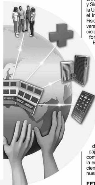
FuturICT aspira a mejorar la gestión de los complejos problemas globales que afectan a la sociedad mediante el uso de las herramientas de la ciencia.

La próxima cita en el calendario de FuturICT tendrá lugar entre el 23 y el 25 de este mes de noviembre en Varsovia (Polonia). Allí representantes de la Comisión Europea, los comités TIC de los países miembros y los seis candidatos a FET Flagship se reunirán para dar a conocer los proyectos definitivos y analizar el desarrollo de sus actividades. Los aspirantes están obligados a enviar un informe final en la primavera de 2012 y, más tarde, se seleccionarán como ganadores a dos de los programas Flagship en competición.