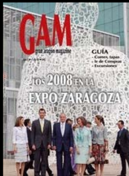
PORTADA REVISTA GAM

http://sites.google.com/site/granaragonmagazine/